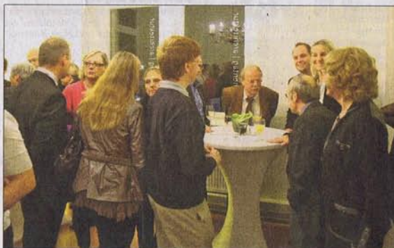
Mit geladenen Gästen wurde kürzlich die Eröffnung des neuen Büros gefeiert.

SCHWÄBISCH GMÜND. Ob Planung und Realisierung von Hochbauprojekten im gesamten Bundesgebiet, zahlreiche Projekte im Planungsbereich der Großgeräte-medicin oder klassische Architekturlösungen wie Wohnungsbau